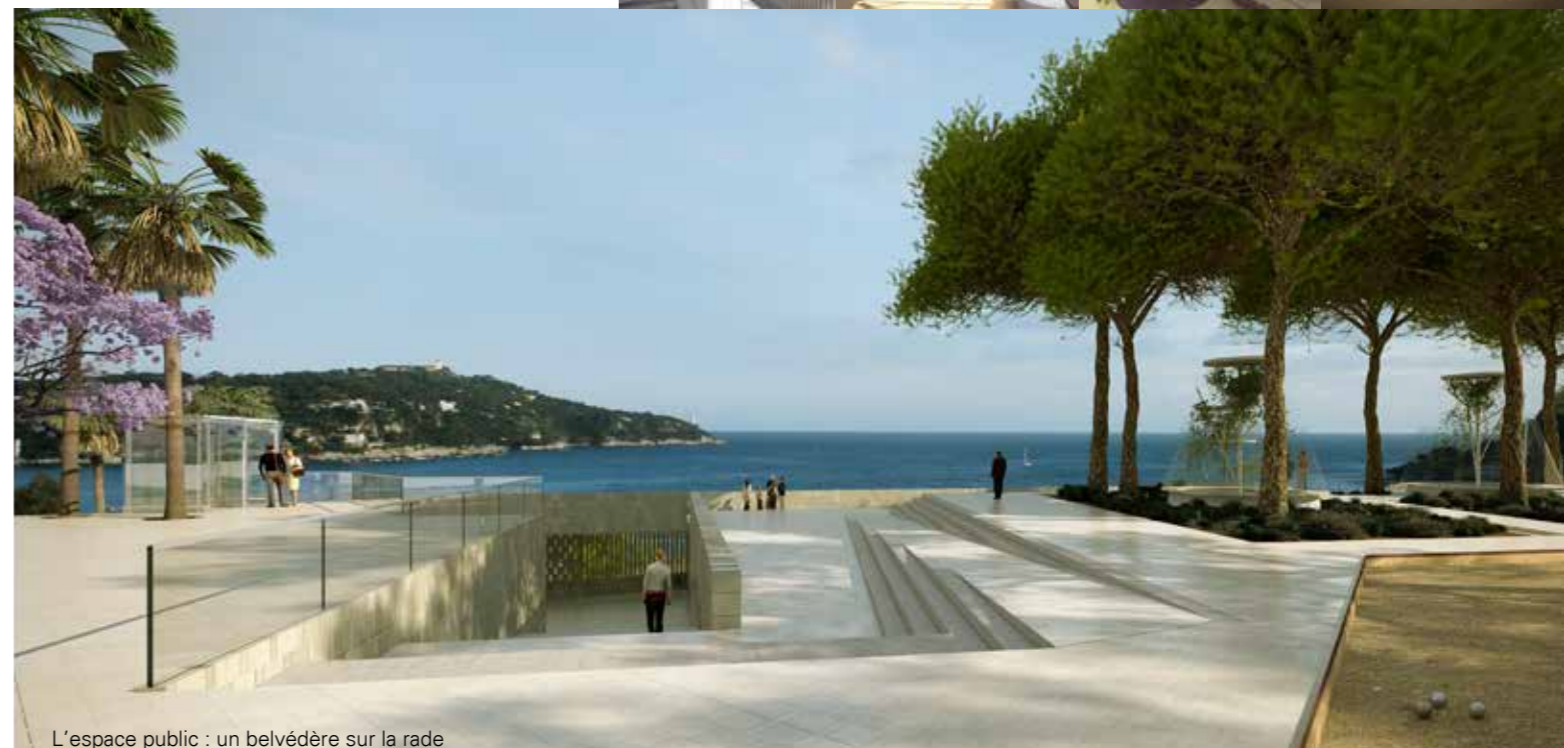
L'espace public : un belvédère sur la rade