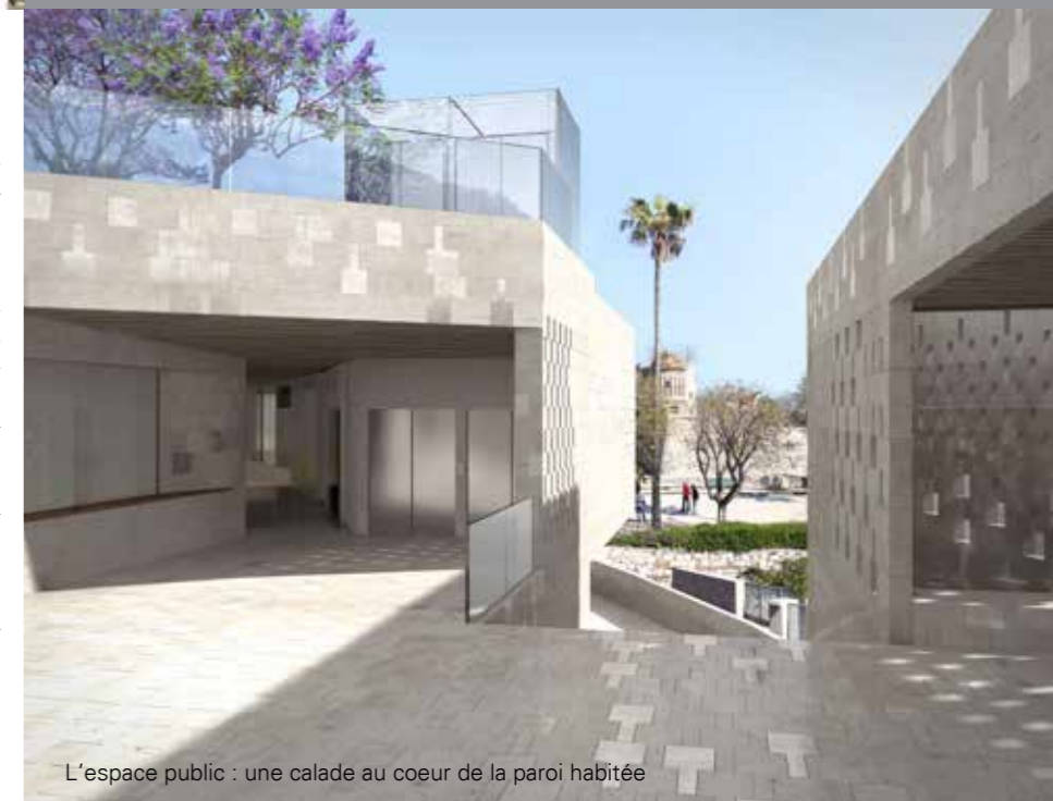
L'espace public : une calade au coeur de la paroi habitée