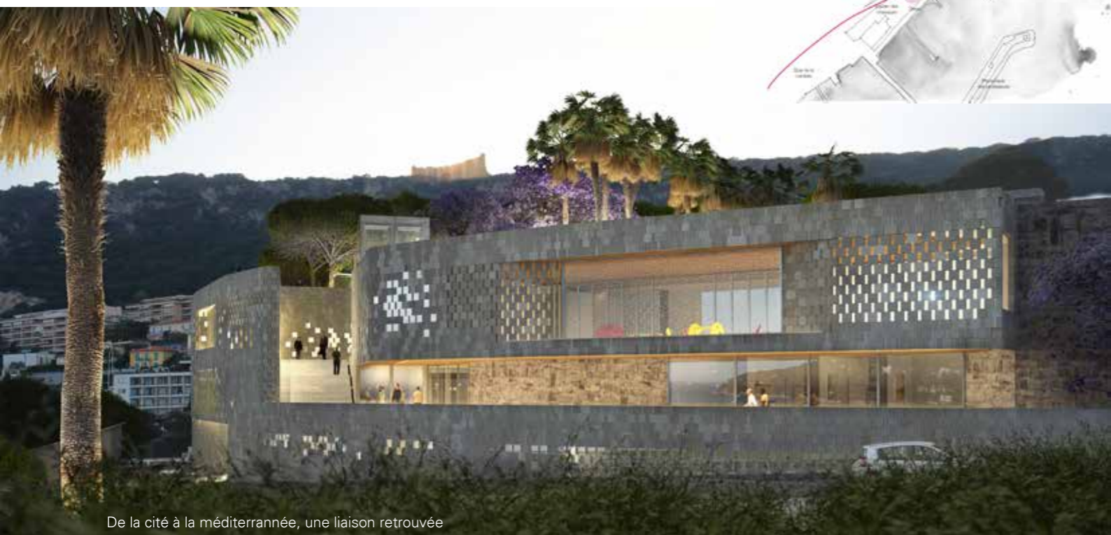
De la cité à la méditerranée, une liaison retrouvée