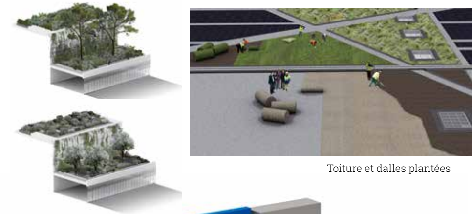
Toiture et dalles plantées