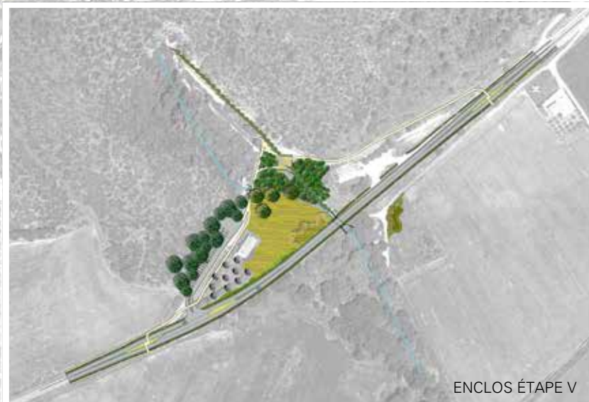
ENCLOS ÉTAPE V