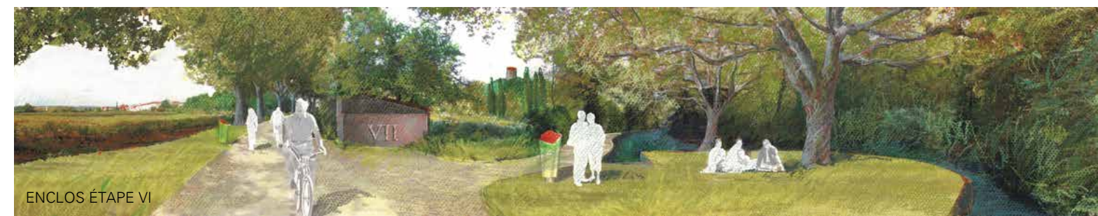
ENCLOS ÉTAPE VI