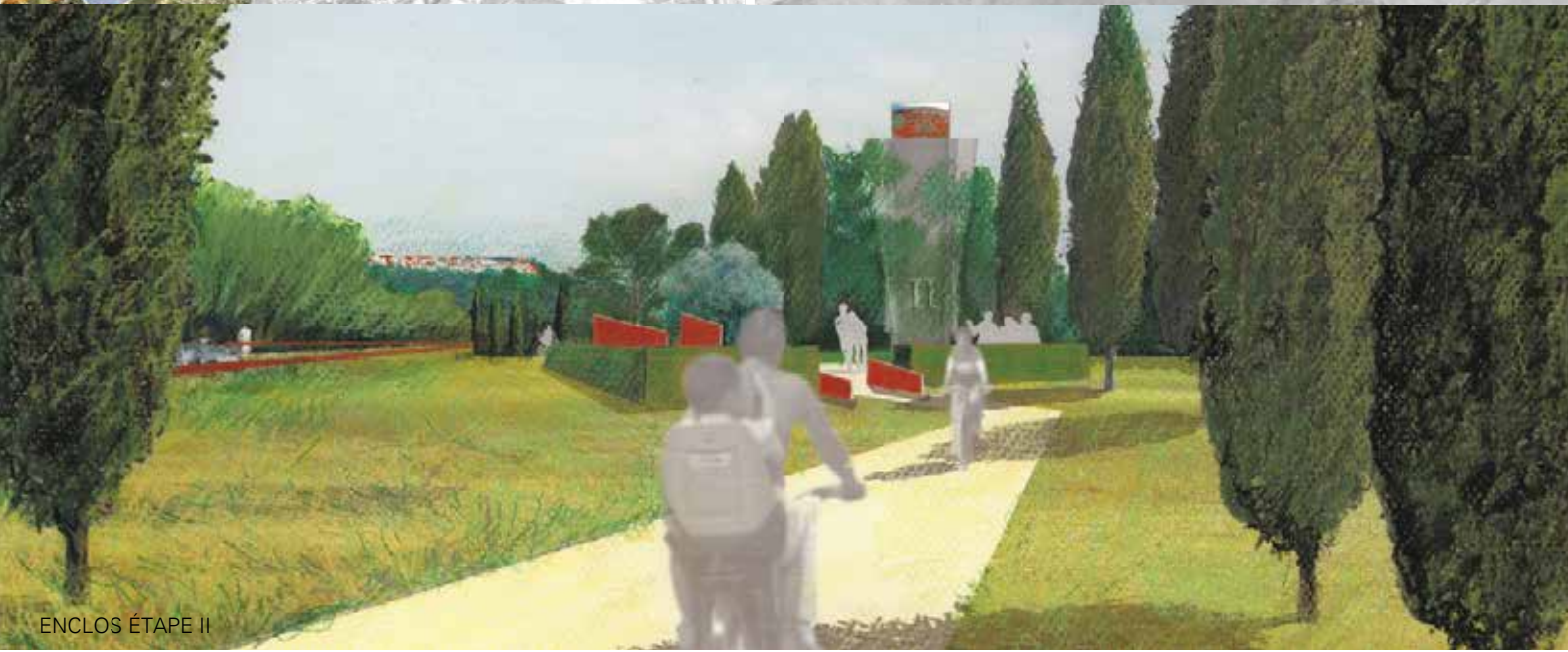
ENCLOS ÉTAPE II